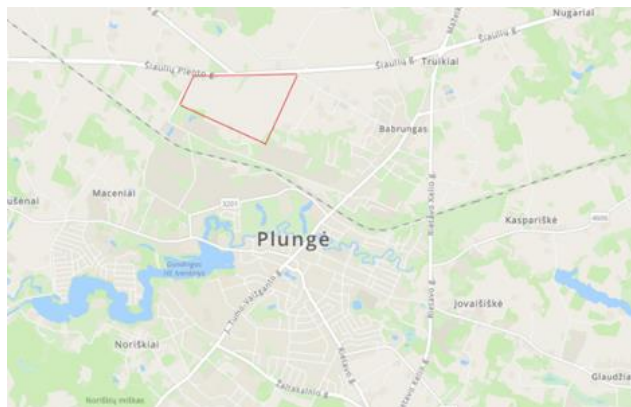
1 paveikslas. Pasirinkta teritorija Plungės pramonės parkui vystyti

Plungės PP, kurio plotas siektų 100,4113 ha, galėtų tapti viena iš svarbiausių investicijų pritraukimo vietų, siūlančių būtent tai, ko rinkai labiausiai trūksta – didelio masto, gerai paruošta pramonine zona. Didelio ploto sklypai leidžia vystyti kompleksines gamybines ir logistikos operacijas, nesudėtingai planuojant infrastruktūrą ir procesų valdymą vienoje vietoje. Lietuvoje stambios įmonės reikalauja vientisų teritorijų, kuriose galima vystyti plataus masto veiklą be būtinybės derinti skirtingų sklypų infrastruktūrą, todėl teritorijų, viršijančių 10 ha plotą, vystymas suteikia didžiausią atsiperkamumą, kadangi pritraukiami stambesni investuotojai.